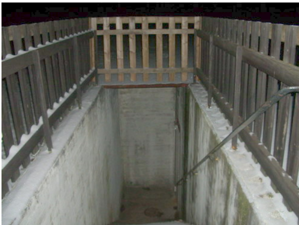
Nytt tak och räcke runt trappan till maskinrummet

En av klortankarna började läcka. Den invallning som gjordes föregående år för att ta hand om just eventuellt läckande klor visade sig fungera.