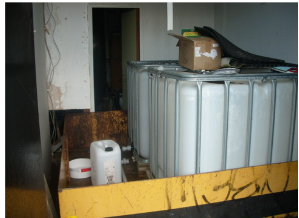
Invallningen för klortankarna fungerar som tänkt.