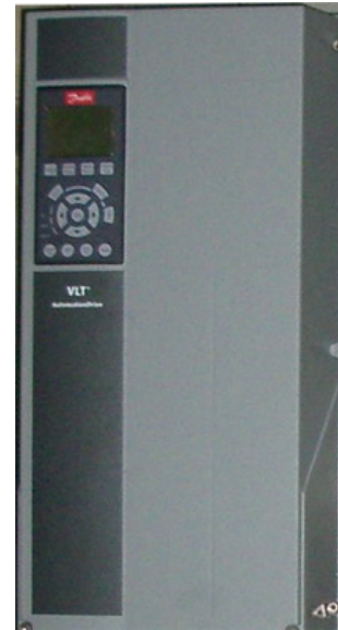
Frekvensomriktare Danfoss FC300

Eventuellt kan man även använda pool- och lufttemperatur som indataparametrar. Ju kallare det är desto mer riskfritt är det att sänka pumpvarvtalet.