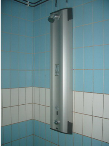
En av de nya duschpanelerna.

Utbyte av en duschpanel i respektive duschutrymme. De nya duschpanelerna är rörelsestyrda och spärrade på temperatur. När ekonomin tillåter finns även behov av att byta övriga duschpaneler.