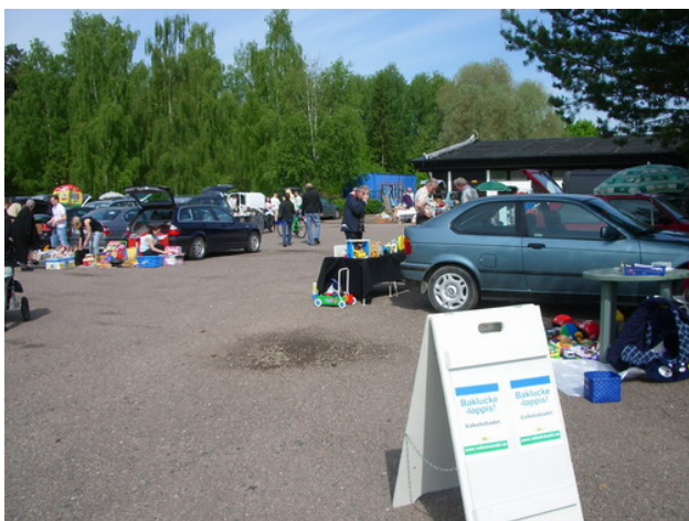
Bakluckeloppis på parkeringen utanför badet.

Valkebobadet har som tidigare år hjälpt till vid aktiviteter som ordnats av SiV, Samverkan i Vikingstad. Vid valborgsfirandet ordnade badet entrélotter med tillhörande vinster och stod eldvakt på natten. Vid julgransplundringen stod badet för entrélotterna. Valkebobadet har också varit representerat vid SiVs möten.