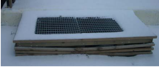
Nytt ventilationsgaller till maskinrummet