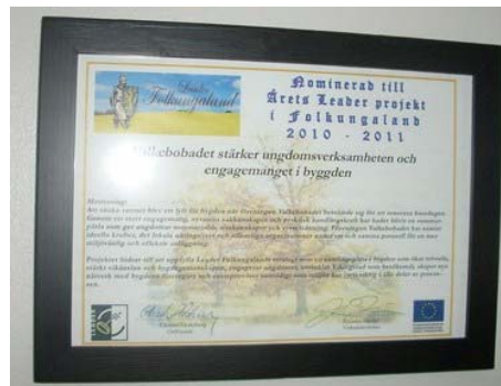
Plakett från Leader Folkungaland

Vi fick även en plakett med denna text som nu sitter på väggen i kiosken. Vi blev bjudna till Kimstad den 11 april 2011 för att presentera vårt Leaderprojekt med nytt grundvattensänkningsystem och poolrenovering. Valkebobadets projekt vann inte men fick mycket beröm ändå. Det projekt som vann i Östergötland var " Digitalteknik på GalaXen "