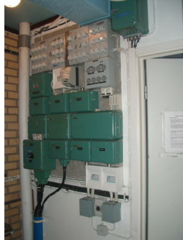
Jordfelsbrytare har installerats för ökad säkerhet

Inför öppnandet av badet installerades jordfelsbrytare i kiosk- och omklädningsbyggnaden. I samband med installationen kopplades flera delar av fastighetens elanläggning bort( utv belysning, belysning tennisbanor, belysning bastu och duschrum, värmeanläggning i omklädningsrum etc) då de omgående löste de nyinstallerade jordfelsbrytarna.