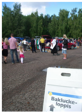
Det finns plats för ca 50 säljare på parkeringen